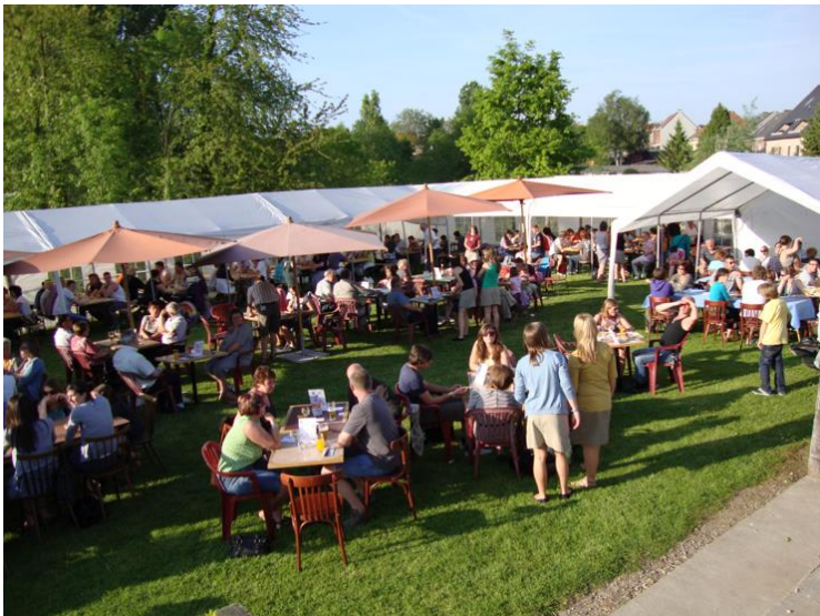
Je ziet hier een deel van de ruim 1300 deelnemers en sympathisanten. Dank en opnieuw uiteraard welkom.

De 16 e Barbekoe zal dit jaar doorgaan op 26 en 27 mei in en rond het jeugdlokaal en de Pax.