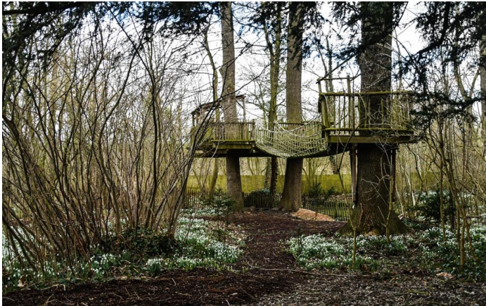
Boomhut die 2 jaar geleden werd gebouwd in de Pastorietuin.