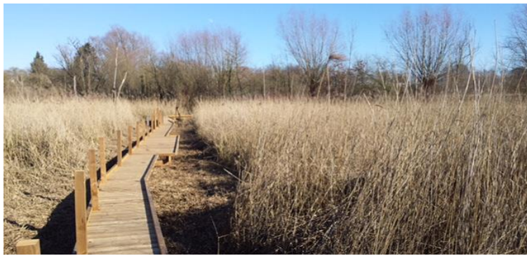
Knuppelpad zoals er binnenkort een wordt aangelegd in het Moerasbos.